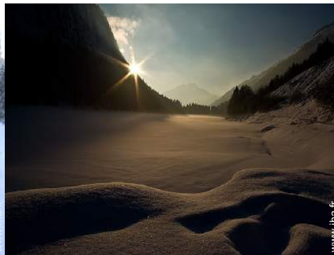
loisirs d'hiver à proximité