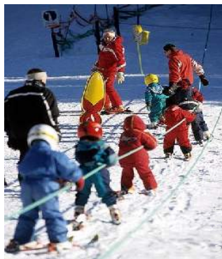
école de ski