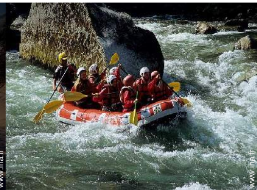
loisirs d'été à proximité