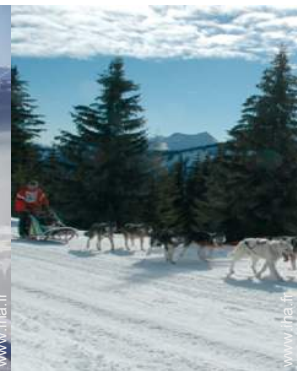
traîneau à chien