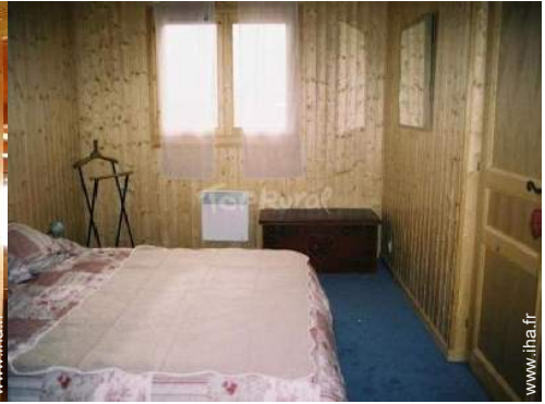
chambre du propriétaire