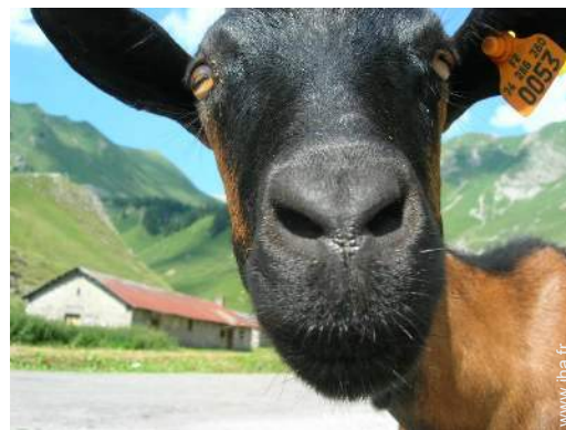
Présence sur place