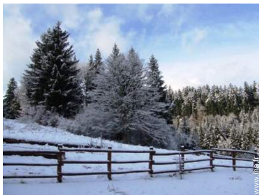
vue sur forêt