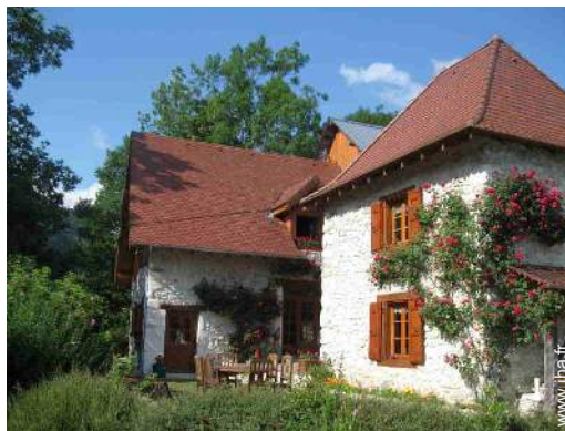
Maison de Charme en Pierre