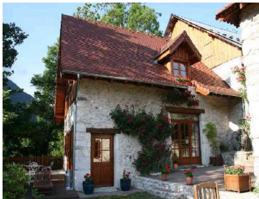
Maison de Charme en Pierre