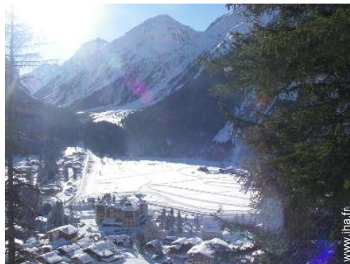
ski de randonnée