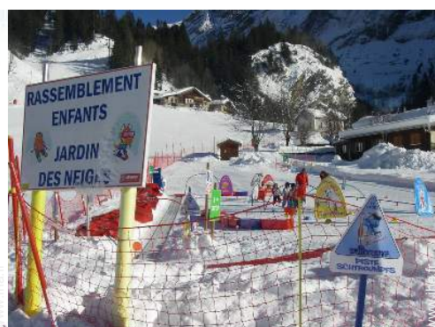
jardin de ski enfant