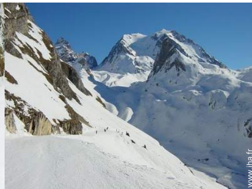
pistes de ski