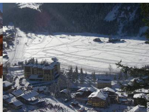
ski hors piste