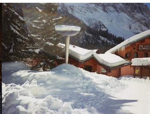
patin à glace