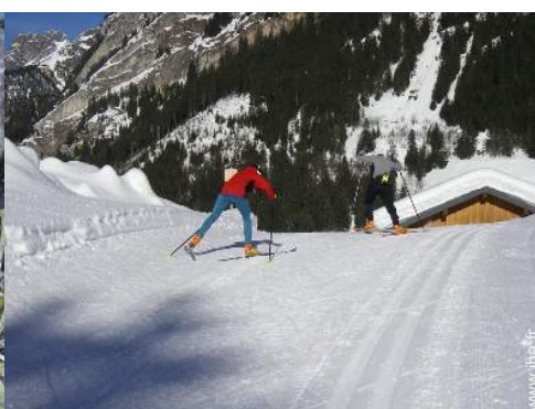
ski de randonnée