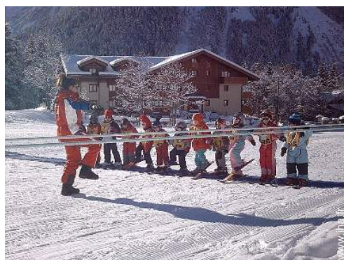
école de ski