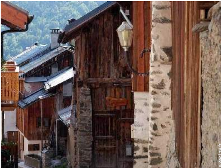
Ancienne Grange de Charme