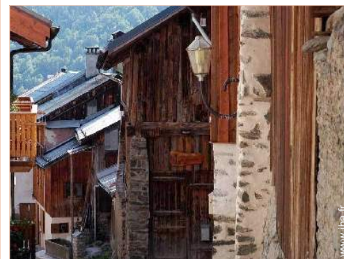
Ancienne Grange de Charme