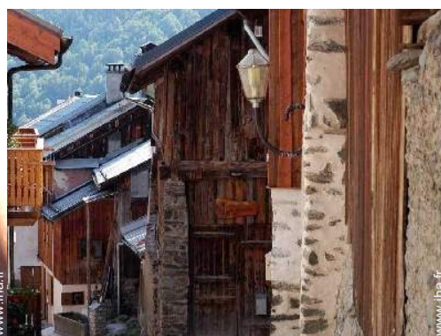
Ancienne Grange de Charme