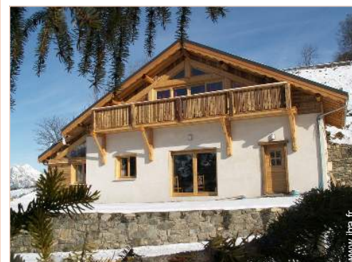
Chalet de Montagne de Charme