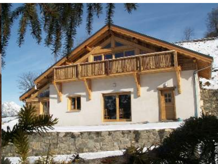
Chalet de Montagne de Charme