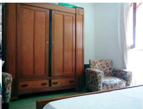
Confort intérieur à disposition des hôtes