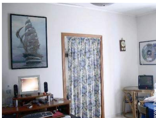
accès internet haut débit