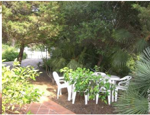
table(s) de jardin