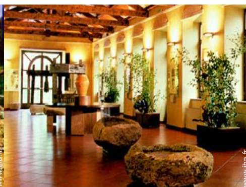
cave et dégustation de vin