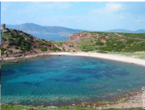
plage de rocher