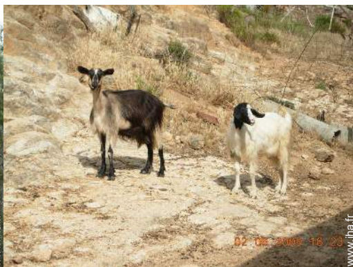
animaux de ferme