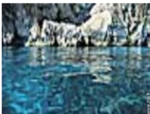
excursion en bateau