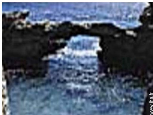
excursion en bateau