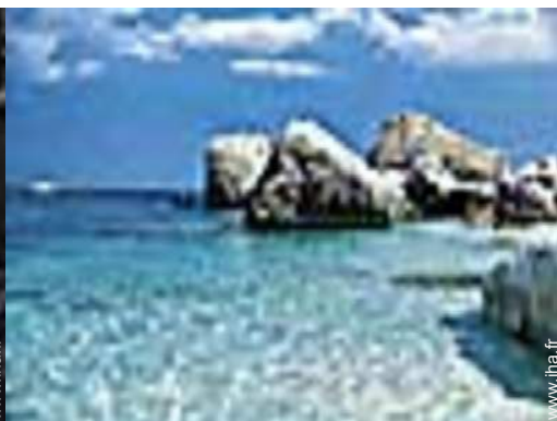
excursion en bateau