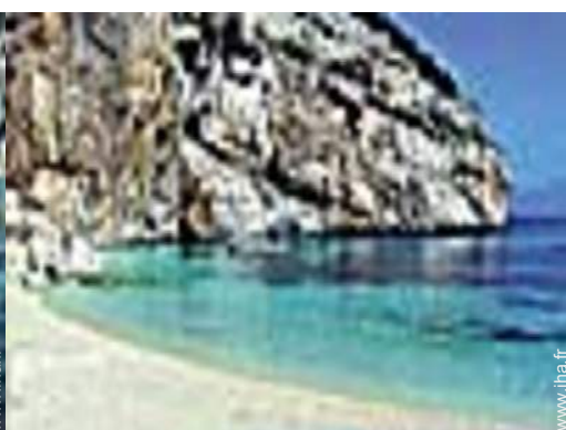
excursion en bateau