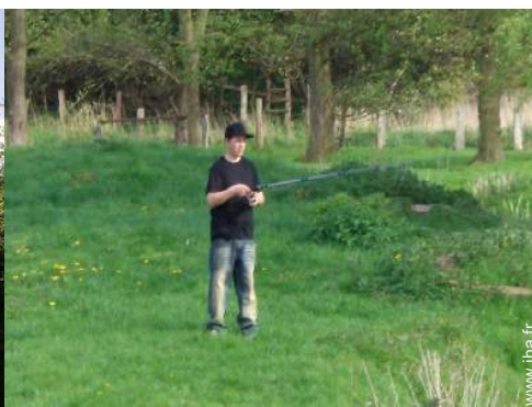
pêche à la ligne