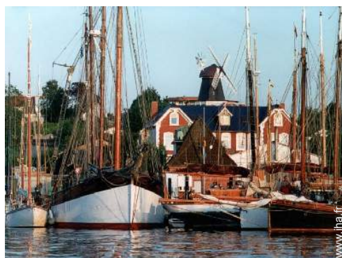
loisirs mécaniques à proximité