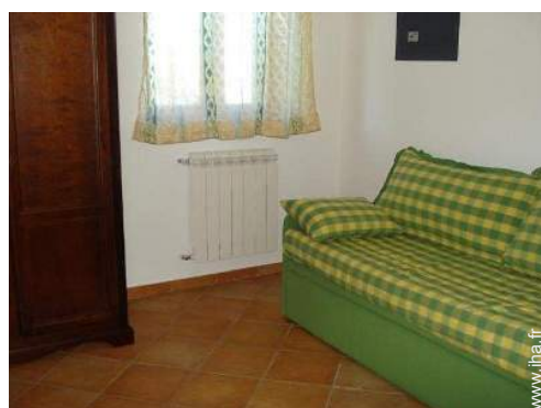
canapé-lit(s) 2 pers