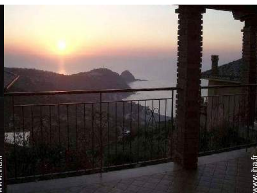
vue sur coucher de soleil