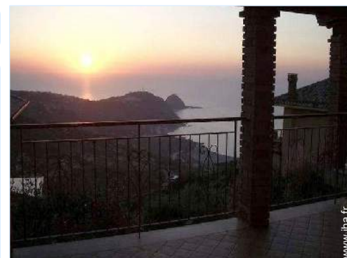
vue sur coucher de soleil