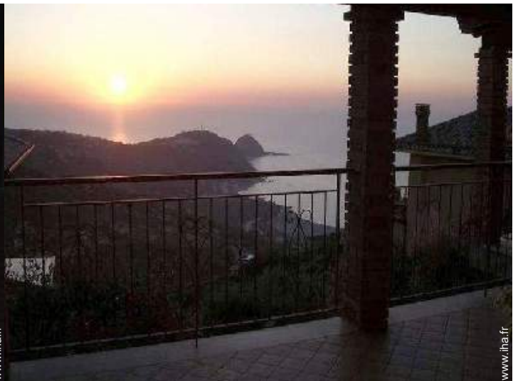
vue sur coucher de soleil