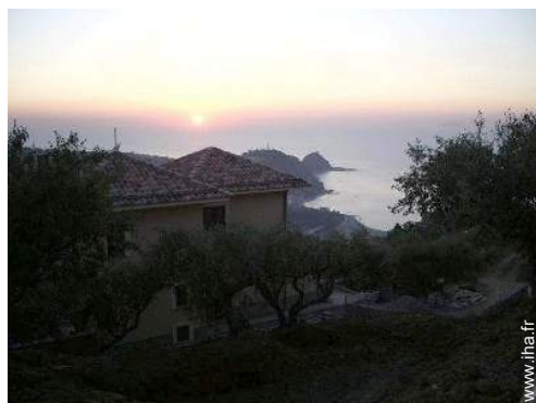
vue sur coucher de soleil