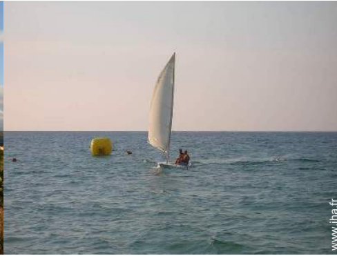
bateau à voile