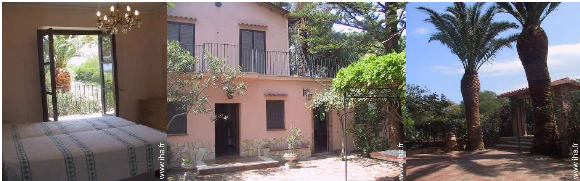
chambre du propriétaire