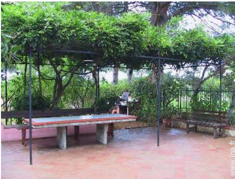
table(s) de jardin