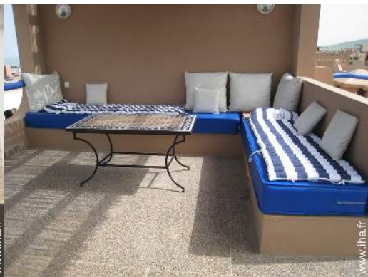
terrasse sur toit