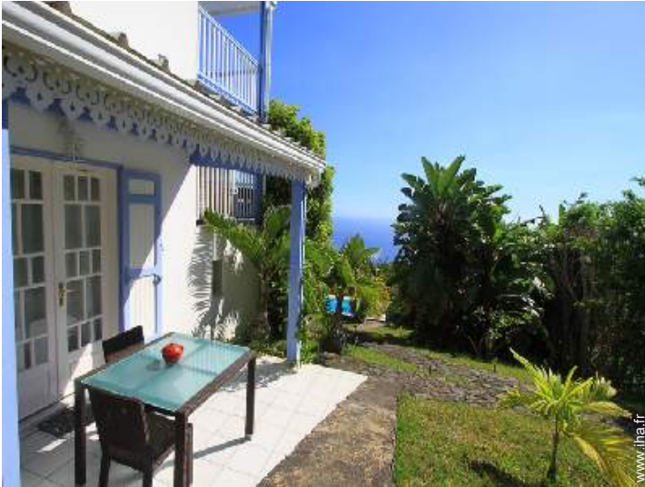
Studio de Charme