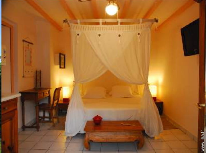
Studio de Charme