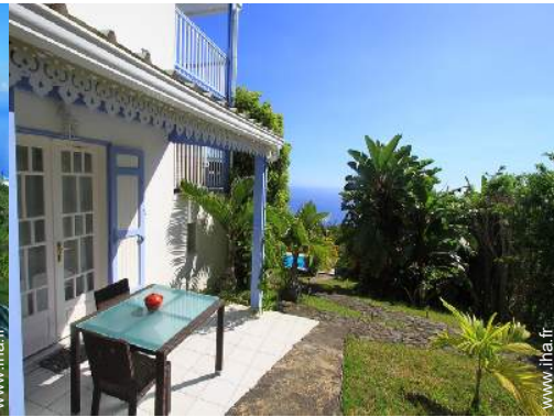
Studio de Charme