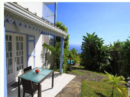
Studio de Charme