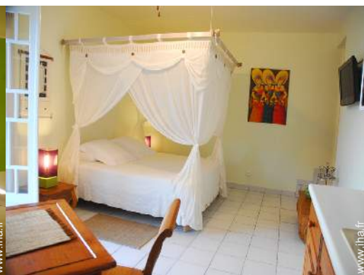
Studio de Charme