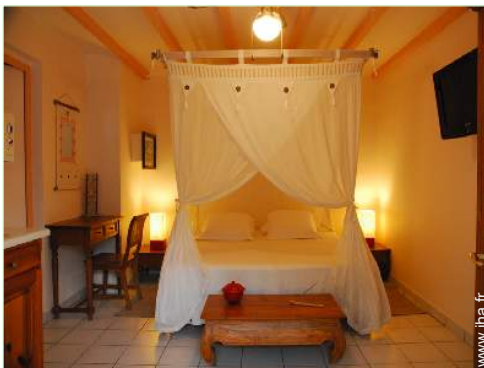
Studio de Charme