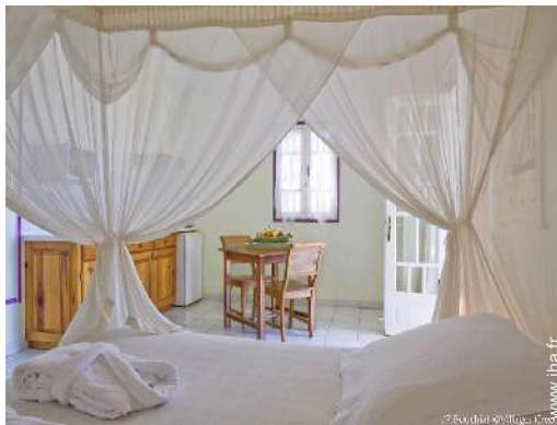
Studio de Charme