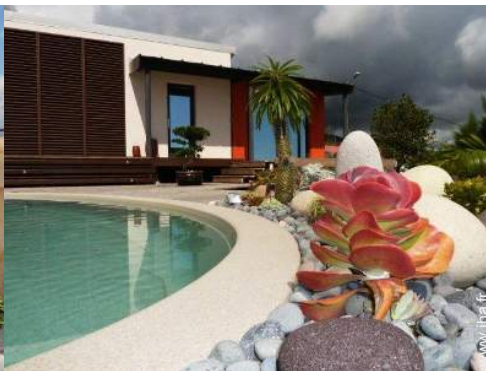
Studio de Charme