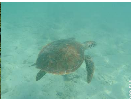
Présence sur place