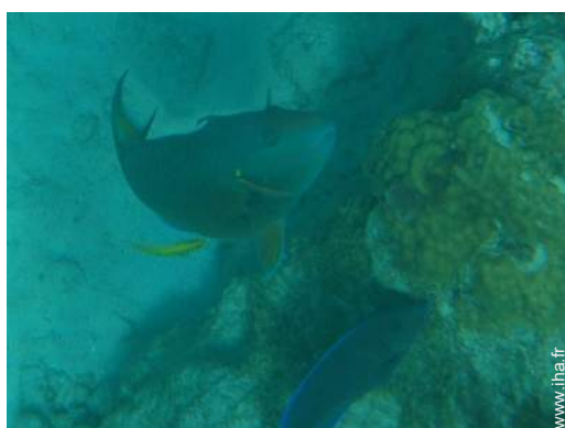
Présence sur place