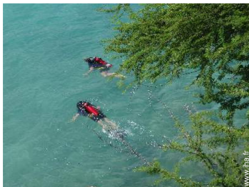
école de plongée