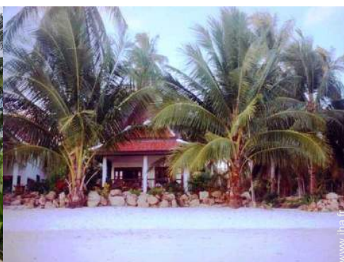
Bungalow de Charme