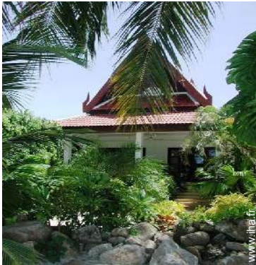
Bungalow de Charme