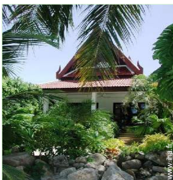
Bungalow de Charme