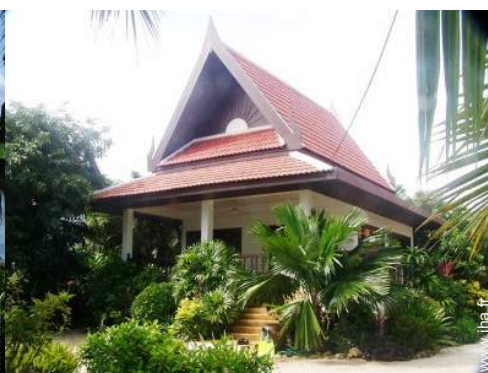
Bungalow de Charme