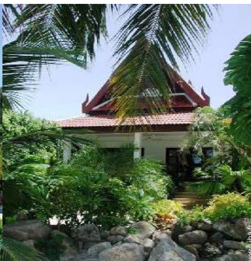
Bungalow de Charme