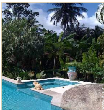
vue sur forêt