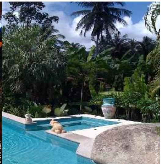
vue sur forêt