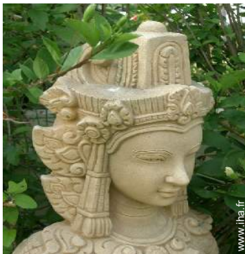
Propriété de Prestige