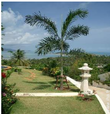
Propriété de Prestige