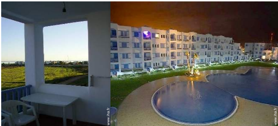
salon de jardin