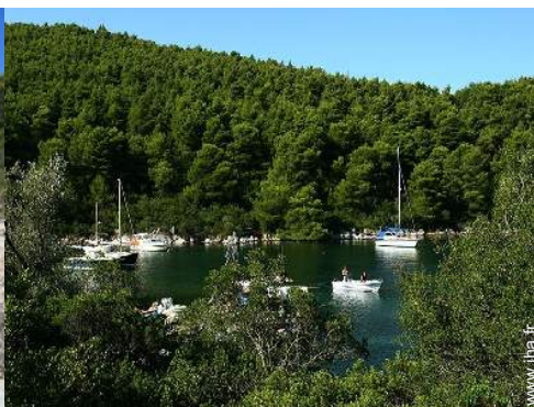
port de plaisance