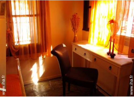
moustiquaire aux fenêtres