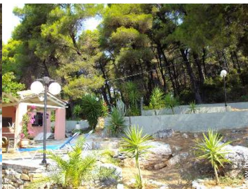
vue sur forêt