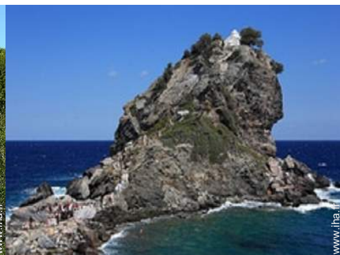
plage de rocher