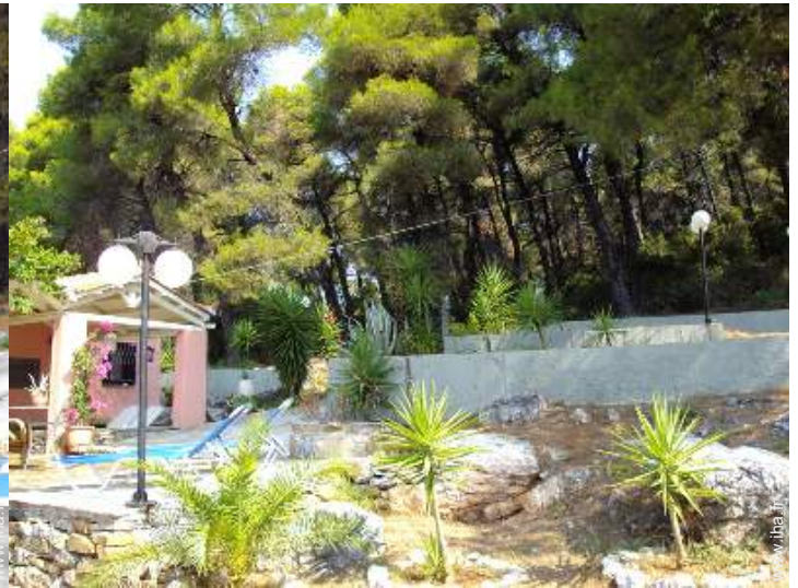
vue sur forêt