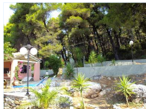
vue sur forêt