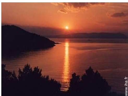
spot de surf