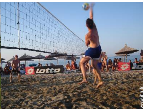
terrain de volley