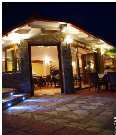
Installation extérieure à disposition des hôtes