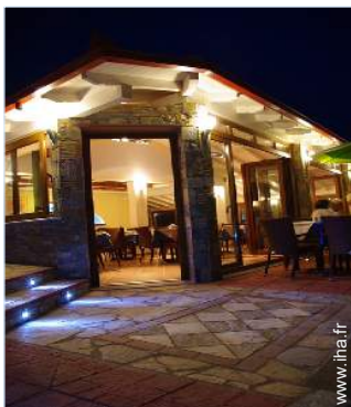
Installation extérieure à disposition des hôtes