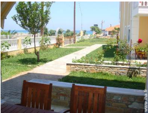
vue depuis la véranda