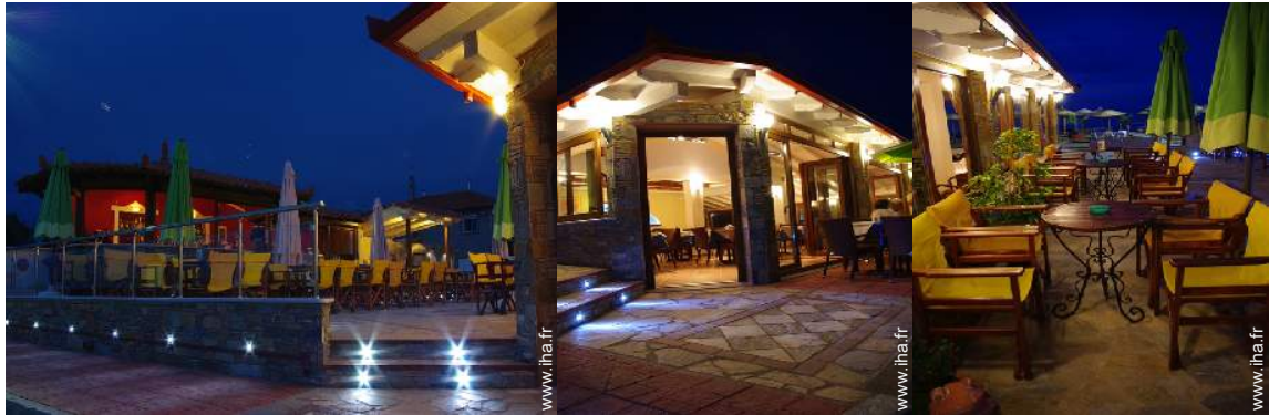
Installation extérieure à disposition des hôtes aménagement de loisirs