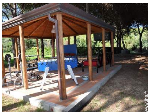
salle de sport