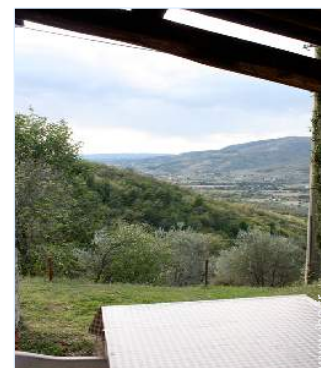
vue depuis le patio