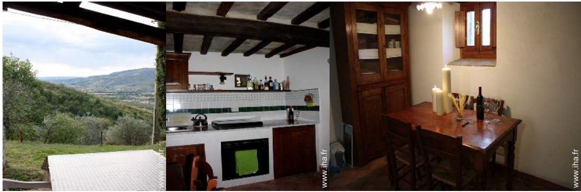
vue depuis le patio