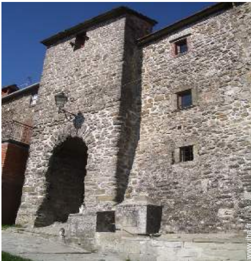
vue sur village