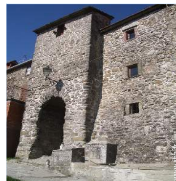
vue sur village