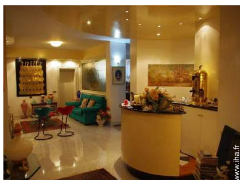
salon de musique