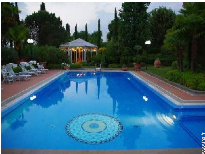
Piscine à débordement