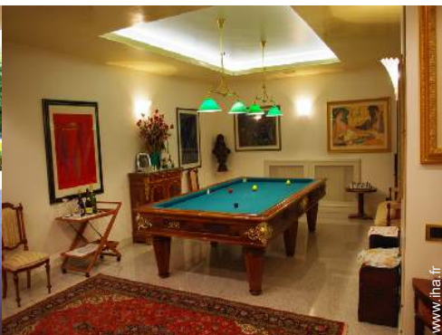
salle de jeux