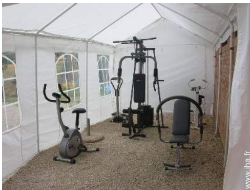
salle de sport