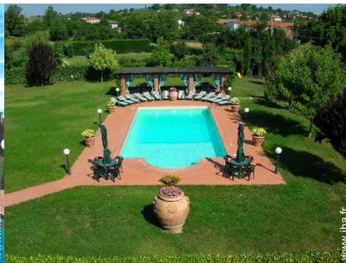
vue depuis la terrasse sur toit