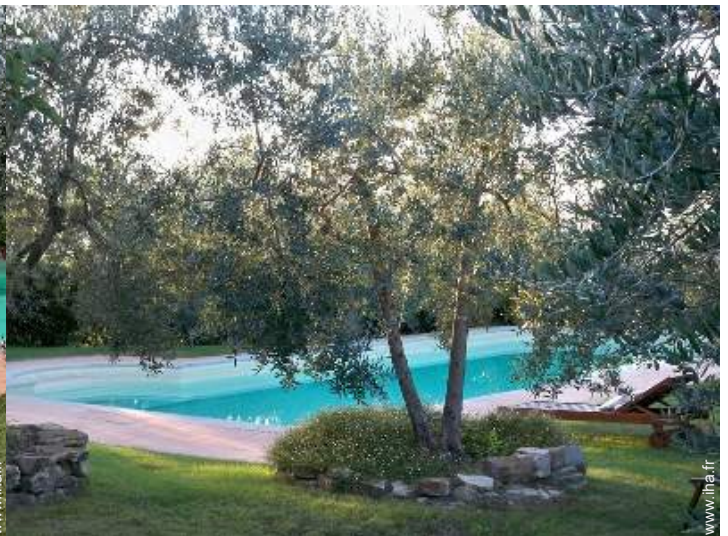
aménagement de loisirs