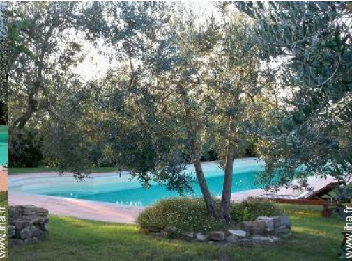
aménagement de loisirs