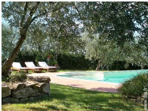
Equipements extérieurs à disposition des hôtes