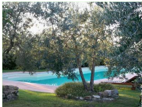
aménagement de loisirs