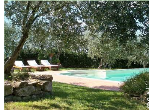
Equipements extérieurs à disposition des hôtes