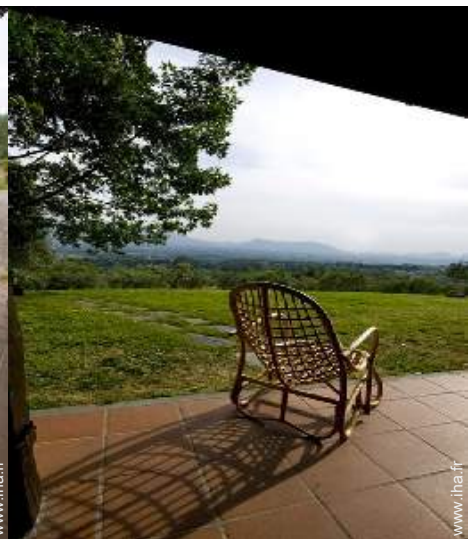
vue depuis la véranda