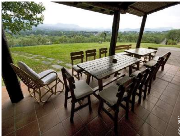
vue depuis la véranda