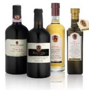
cave et dégustation de vin