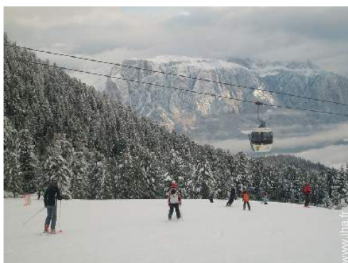
pistes de ski