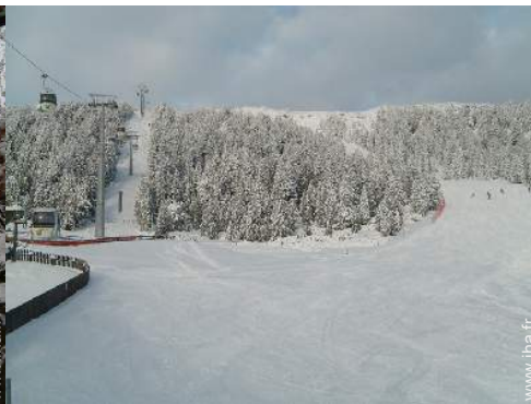
pistes de ski