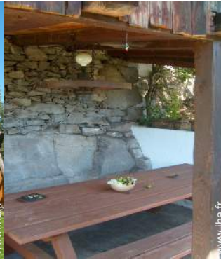
table(s) de jardin