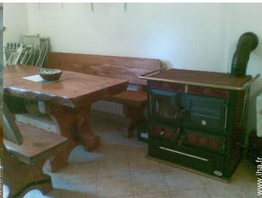
poêle à bois