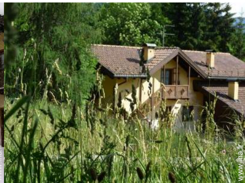
Lotissement de standing