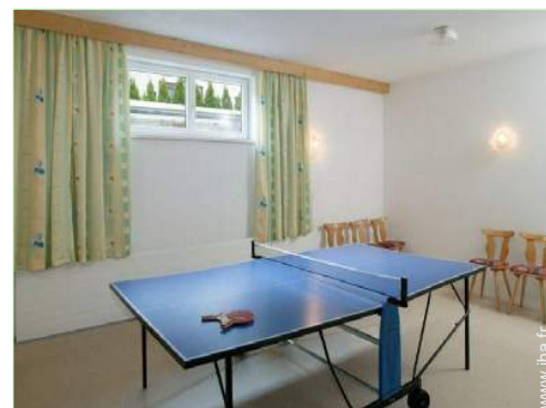
table de ping-pong