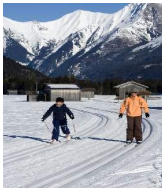
ski de fond