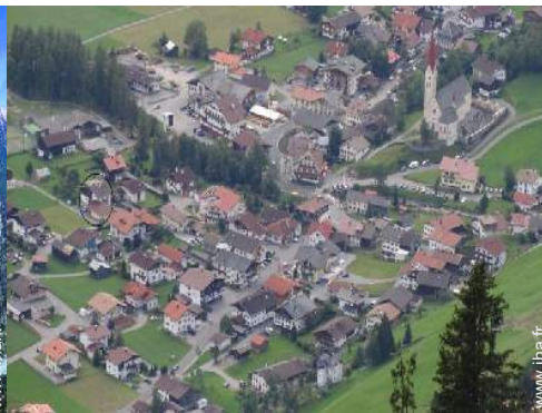
vue sur centre village