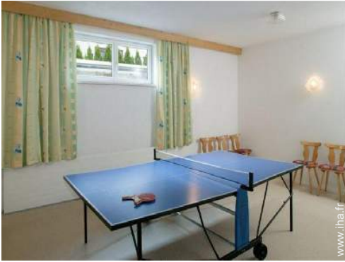
table de ping-pong