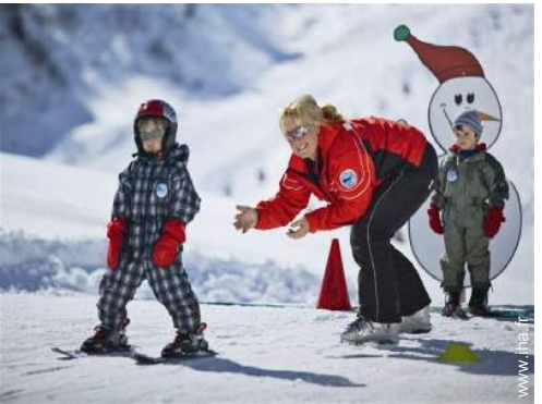
jardin de ski enfant