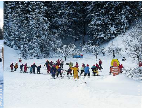
jardin de ski enfant