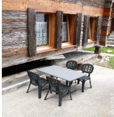
chaise(s) de jardin