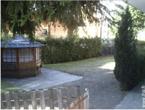
abri de jardin