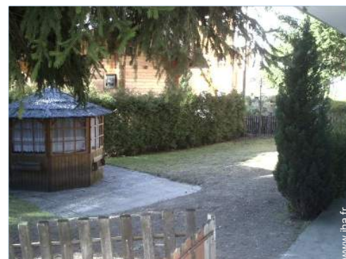
abri de jardin

Cour privée 60m 2 , terrain clos < 100m 2 , pelouse 60m 2