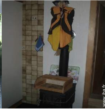
poêle à bois