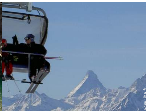
loisirs d'hiver à proximité