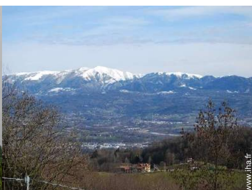
vue depuis la loggia