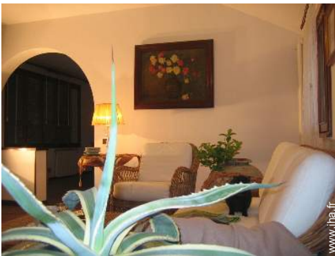
vue depuis le bureau