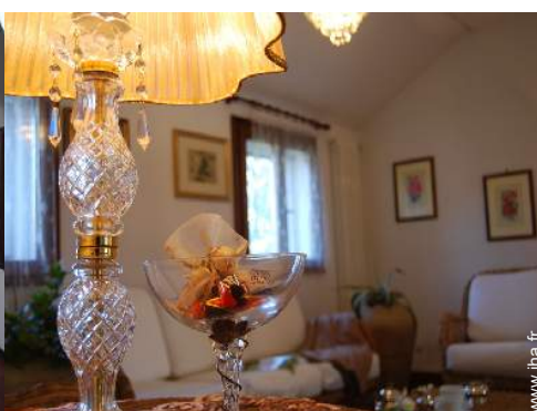
vue depuis le bureau