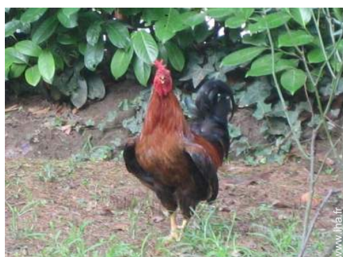
animaux de ferme