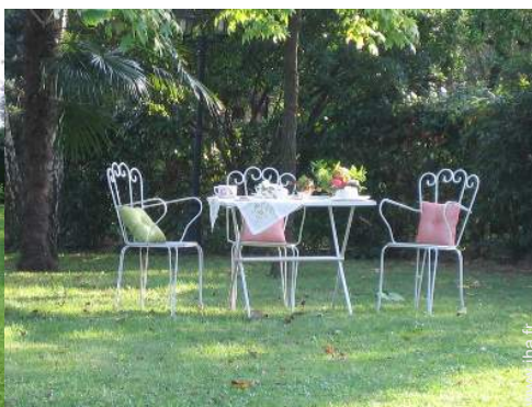
vue sur prairie