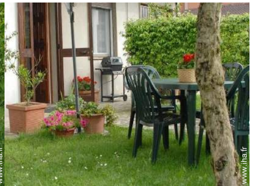
barbecue à gaz