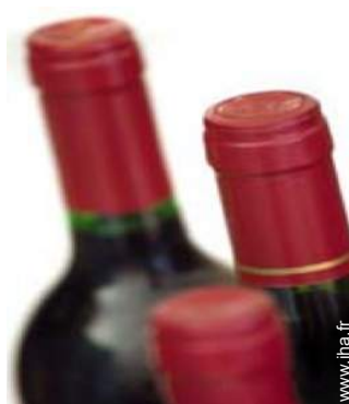
cave et dégustation de vin