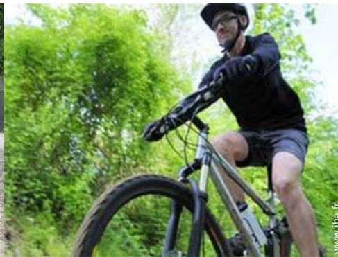
loisirs de montagne à proximité