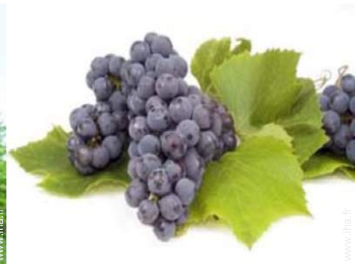
cave et dégustation de vin