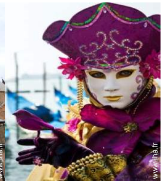
Villes à proximité