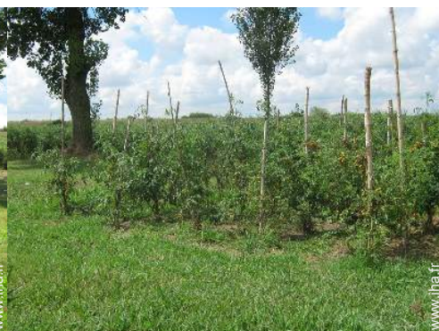
vue sur campagne