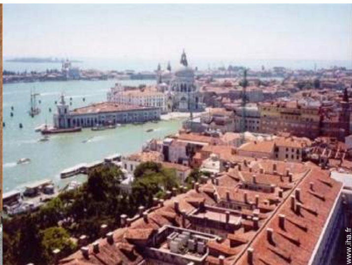
vue sur ville