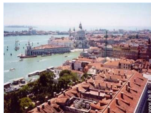
vue sur ville