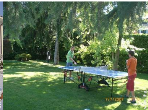
table de ping-pong