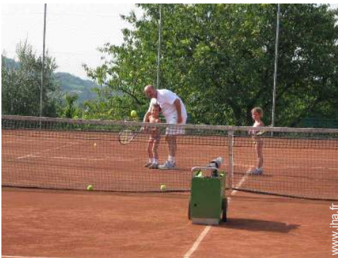
Tennis - terre-battue