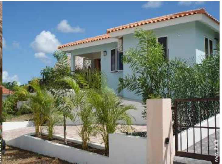
Villa de Charme