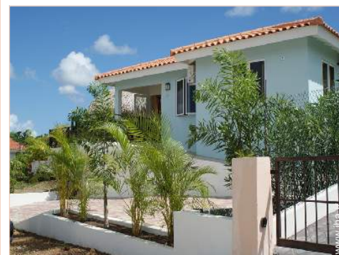
Villa de Charme