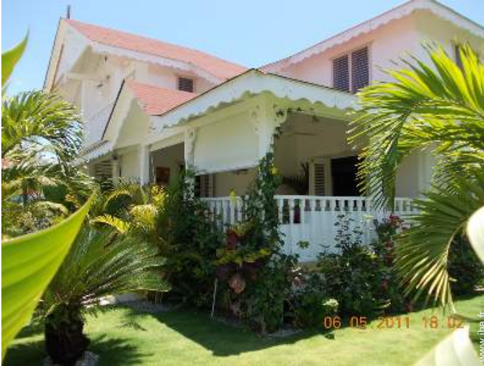
Villa de Charme