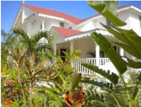
Villa de Charme