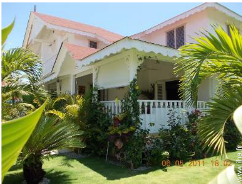
Villa de Charme