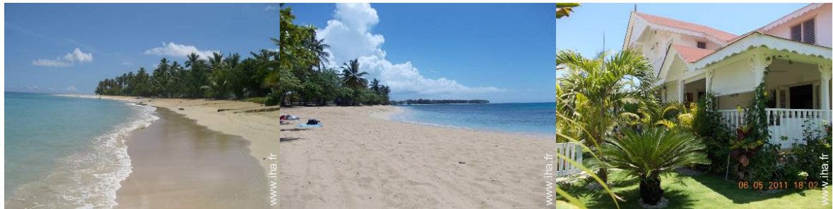
Attraites et détente