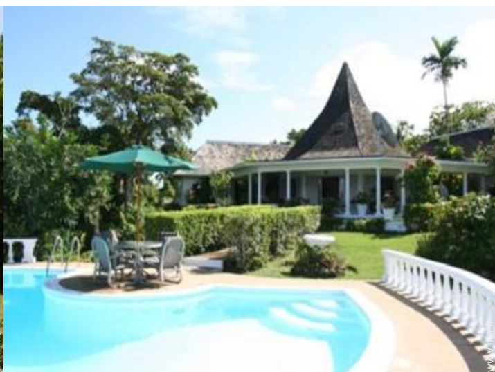
Villa de Charme