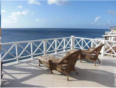
vue sur océan