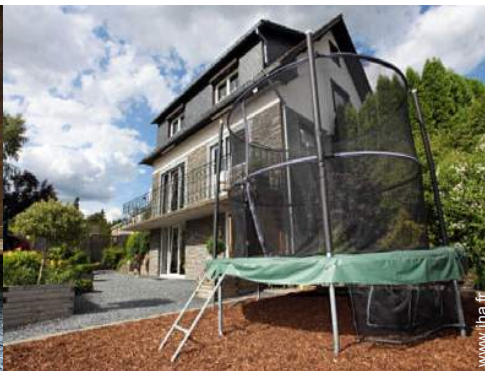
terrain de pétanque